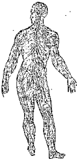
मानव चरित्रक शिष्ट